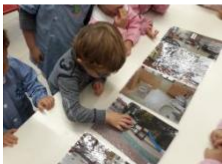
Classe degli arancioni: