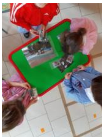
Classe dei verdi: