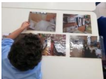
Classe dei rossi: